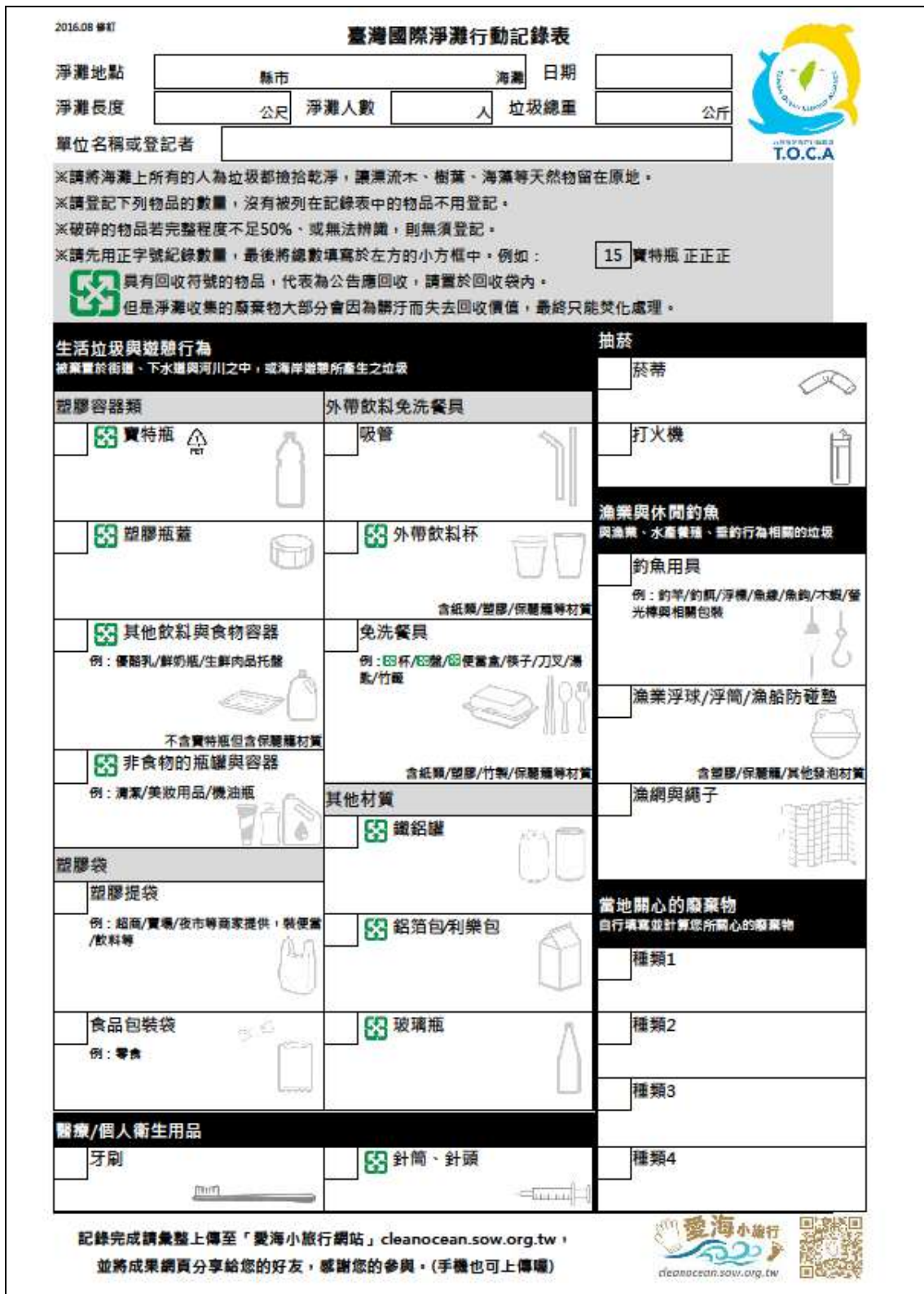
附表一 臺灣國際淨灘行動記錄表(ICC)