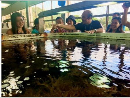
珊瑚人工繁殖與受傷海龜救援情況