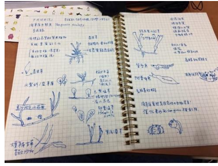
學員們認真的筆記(海草)