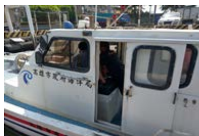
辦理「高雄一號」公務稽查艇老舊零件汰換暨維護