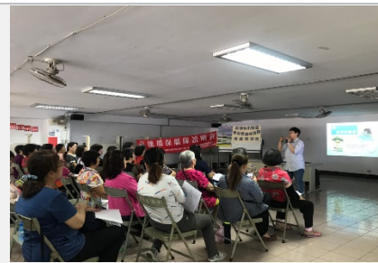
持續推動轄區環保艦隊