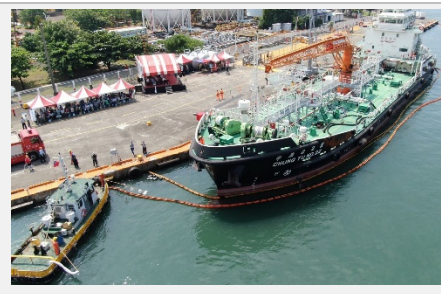
辦理海洋污染防治應變演練