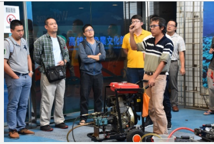
辦理海洋污染防治專業訓練班