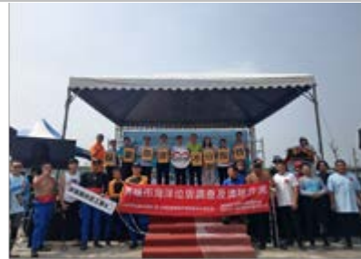
辦理 16 場海洋環境教育宣導活動