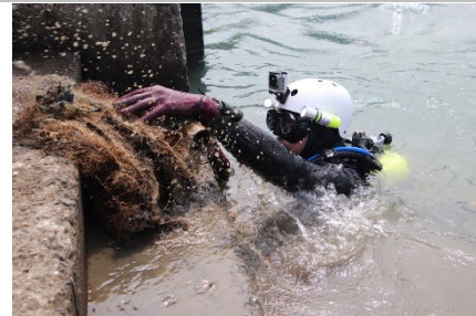
辦理 10 趟次淨海作業