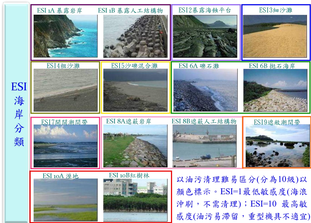
附圖 1 ESI 海岸分類圖

依「臺灣環境敏感指標(ESI)地圖海岸調查手冊」,有關海岸線類型區分為 10 類(如附圖 1),針對各類型海岸彙整建議適當之清污策略與作業方式,以為依循。