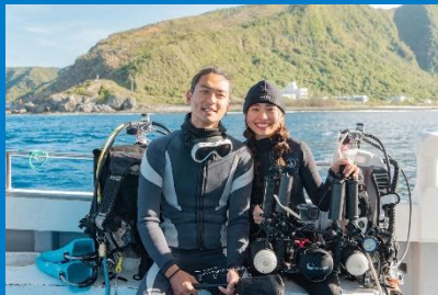
淨海前哨站列傳 - 海洋星球 - 看見海、走向海、成為海的一部分(上)