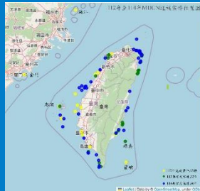
海廢清除網(MDCN)執行成果