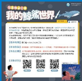
「我的鯨鯊世界」- 兒童繪畫比賽