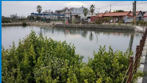
海保署x海洋局x高科大展現藍碳復育示範成果