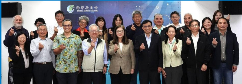
首屆海洋保育審議會成立