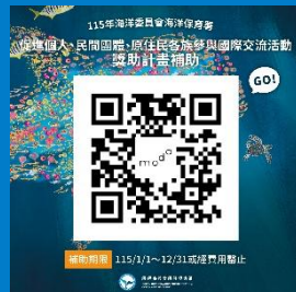
115年海洋保育國際交流補助計畫