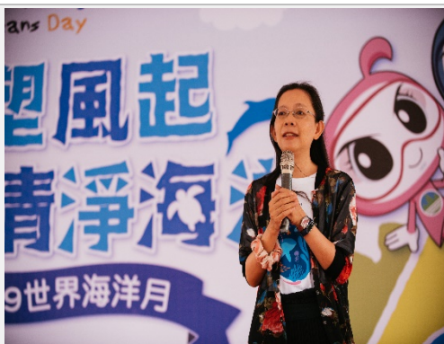
海保署黃向文署長蒞臨指導