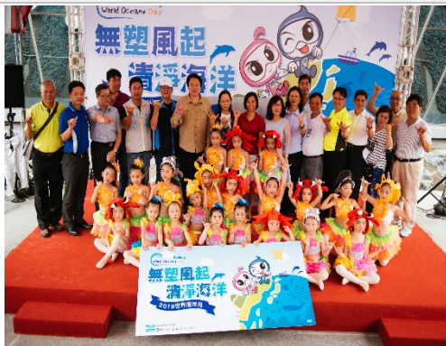
世界海洋月啟動儀式