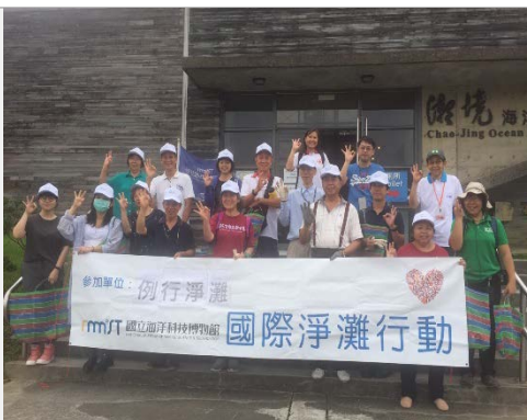
培育淨灘種子教官