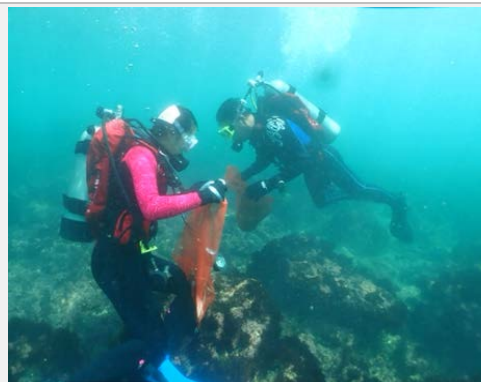
潛水人員清理海底垃圾