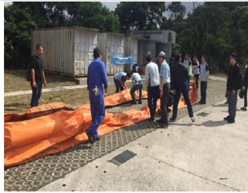
應變小組專業訓練