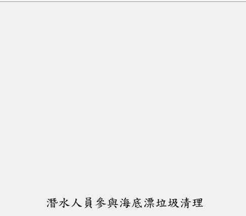
潛水人員參與海底漂垃圾清理