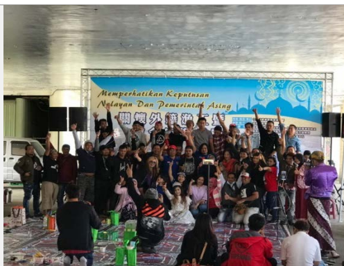
外籍漁工宣導垃圾不海拋