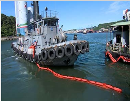
結合海軍投入海洋污染應變演練