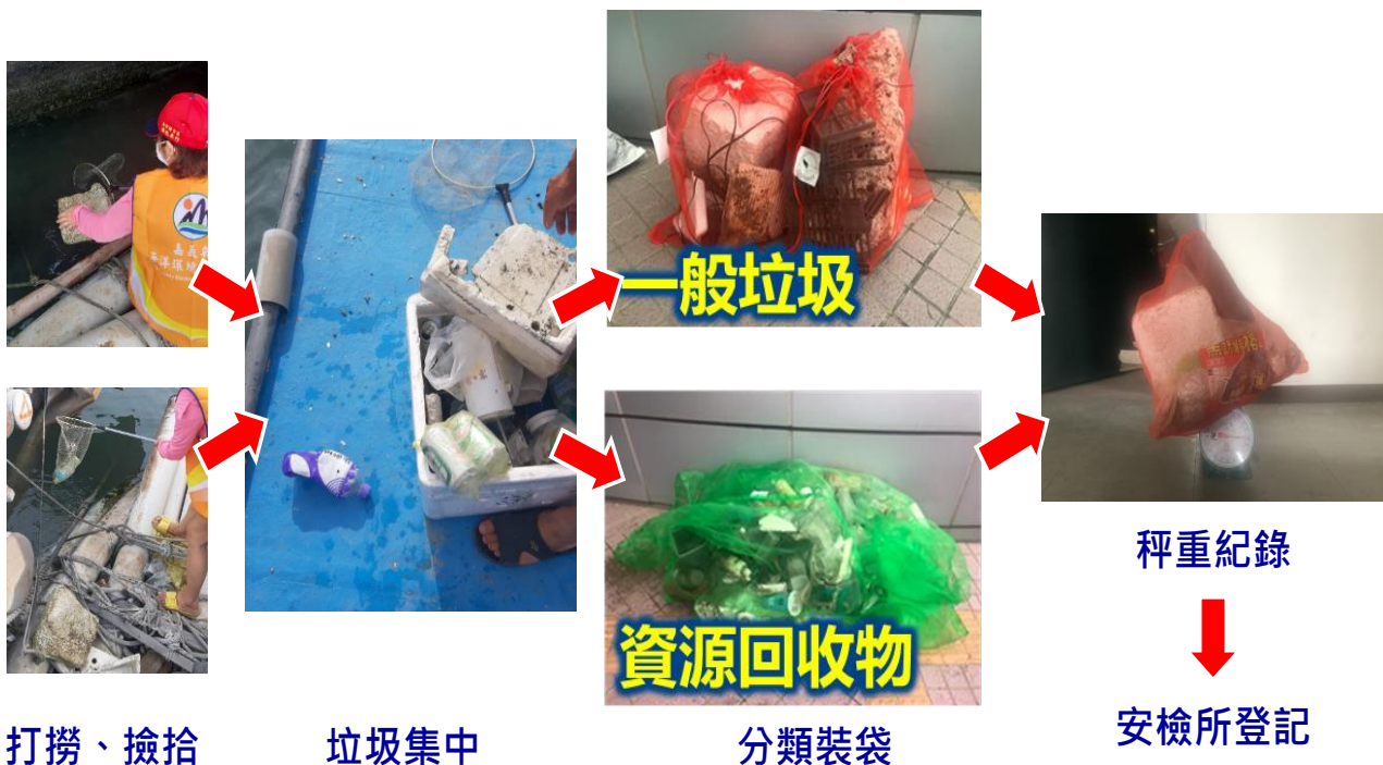
圖 3、海洋垃圾清除作業流程