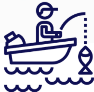
1-4月垂釣方式與縣市分布

堤/岸釣(366筆)、港區垂釣(340筆)、 岩礁岸釣(38筆)、岩釣(18筆)、礫灘釣(6筆)， 臺中市與新北市占堤/岸釣、港區垂釣最大宗