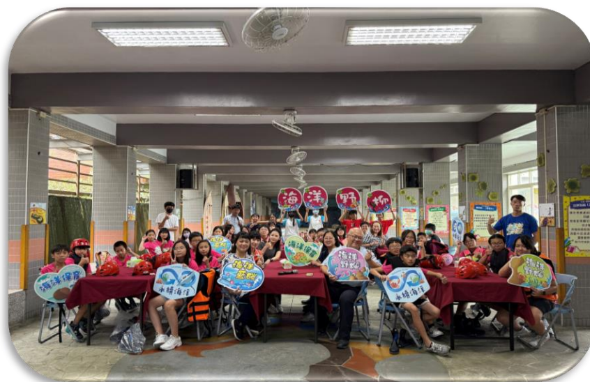
推廣海洋資源永續從日常餐桌開始