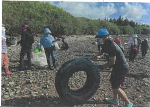
(代表性照片 1)淨灘活動