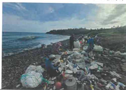
(代表性照片 2)灘岸堆積海漂廢棄物