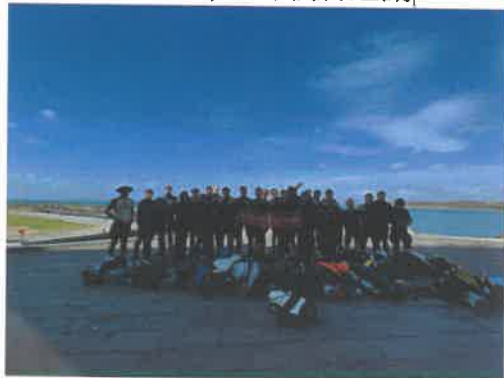
(代表性照片 3)潛海戰將活動