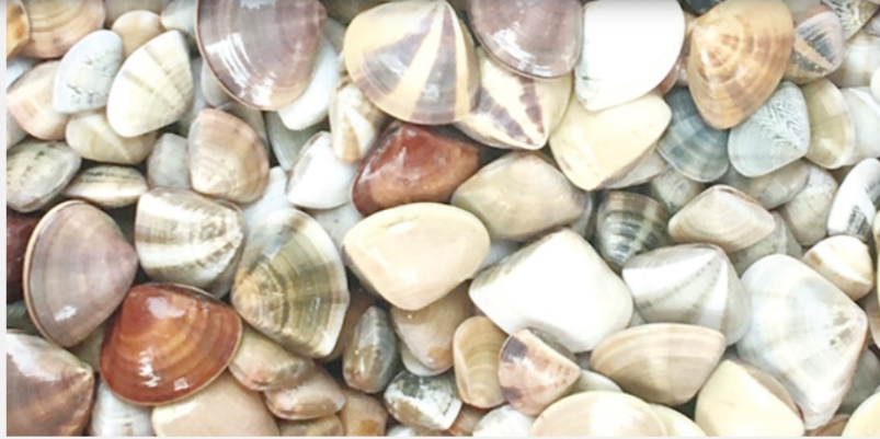
好食金門海洋漁活動，認識金門的魚蝦貝類。

金門縣水產試驗所預定於6月3日(星期六)辦理一場「好食金門海洋漁」海洋保育講座暨環境教育走讀活動。對象以國中以上至成人為主，國小學生需由家長陪同參與，活動人數限額30名。活動的流程以及相關規定，請民眾上網報名網站 https://reurl.cc/M871K3 進行了解，水試所歡迎有興趣的民眾踴躍報名。水試所表示，這場講堂暨環境走讀課程，將安排走訪水試所、新湖漁港金門漁業文化館以及成功沙灘，內容將規畫包含金門傳統漁業文化、漁業資源現況及危機，並於海岸走讀活動中安排傳統漁法|牽網作業，在體驗傳統漁業文化的同時也學習辨別在地漁獲物種等豐富多元活動。由於對海洋資源的過度開發、混獲、海洋汙染以及棲地破壞等問題，造成世界海洋的漁獲量已經呈現負成長，而根據漁業署漁業統計年報顯示，金門地區沿岸近海漁業的產量，近年來也有向下發展的趨勢。這場由海洋保育署經費補助的「好食金門海洋漁」活動，就是希望能藉由安排專家學者的海洋保育講堂及環境教育走讀活動，讓參與者能深入了解金門傳統漁業、漁業資源現況及面臨的危機，並宣導友善漁業資源及海洋環境保護之重要性，期能與鄉親攜手共同建立嶄新的金門海洋漁業文化。